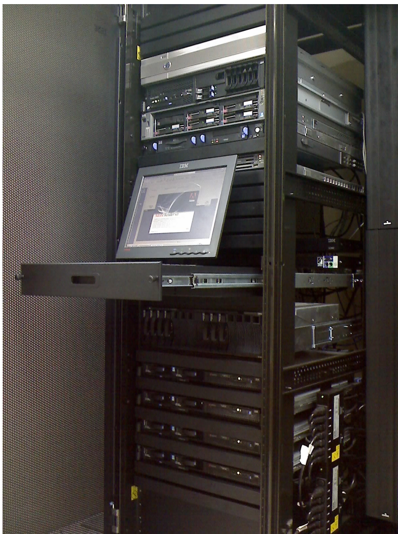
Figuur 2.1:

Om hogere dichtheden te bereiken wordt er gebruik gemaakt van blade servers. Bij blade servers zitten er meerdere servers (blades) in één fysieke behuizing (19"-kast). De servers delen een backplane, de voeding(en) en de behuizing waardoor er effectief meer servers passen op dezelfde oppervlakte. Een nadeel van blades is dat de warmte ontwikkeling ook veel meer geconcentreerd wordt en dat kan leiden tot zogenaamde hotspots, wat slecht is voor de koeling.